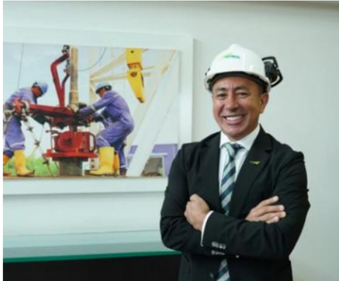
El presidente de Ecopetrol, Ricardo Roa, ha mantenido los contratos comerciales suscritos con Citgo por su antecesor.

La relación comercial entre Ecopetrol y Citgo, la filial de Petróleos de Venezuela (PDVSA), ha logrado mantenerse al punto que ese negocio representa la quinta parte del crudo colombiano que se exporta hacia Estados Unidos.