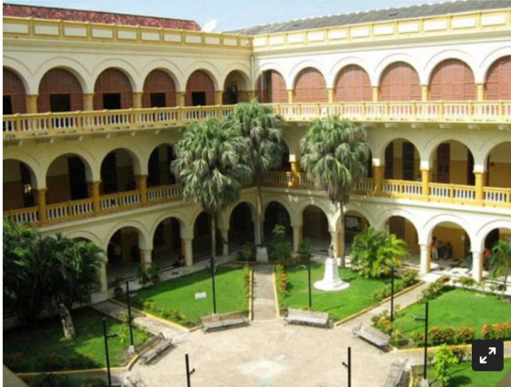
Carecemos de recursos para cumplir con obligación: Universidad de Cartagena a Ecopetrol (Universidad de Cartagena)

Desde la Asamblea Departamental pidieron frenar convenios y acuerdos que se hacen con la Universidad, "que no tiene claridad dentro del manejo de las finanzas"