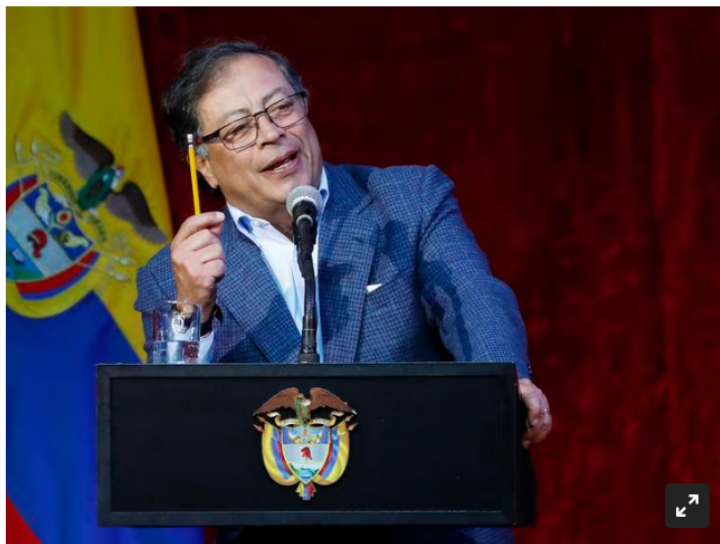
Gustavo Petro.