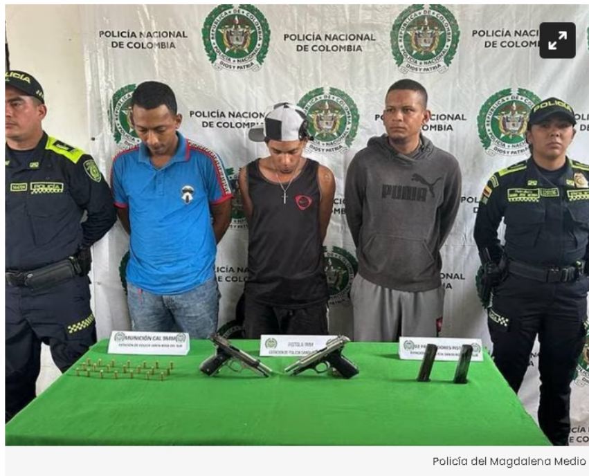
Policía del Magdalena Medio