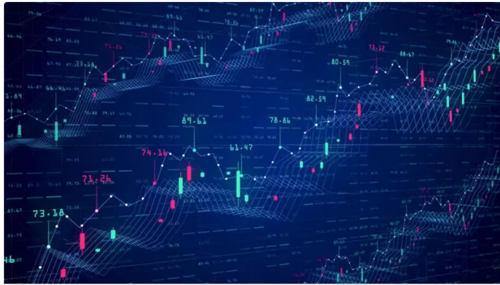
Acción de Ecopetrol cae: precio y cotización en bolsa hoy 23 de febrero de 2024

Así se comportan las acciones de Ecopetrol en la Bolsa de Valores de Colombia este 23 de febrero