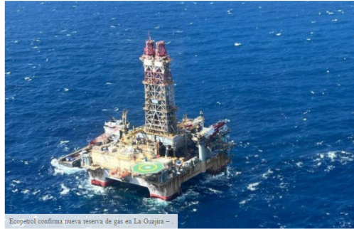
Ecopetrol confirma nueva reserva de gas en La Guajira -

A través de un comunicado oficial, Ecopetrol anunció el descubrimiento de dos nuevos yacimientos de gas en el pozo Orca Norte-1, en La Guajira.