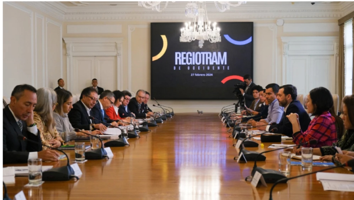
Reunión Gobierno para Regiotram

En una reunión encabezada por el presidente Petro y el alcalde Galán, se acordó uno de los planes de soterrar cuatro kilómetros de tuberías de transporte de combustibles para el Regiotram.