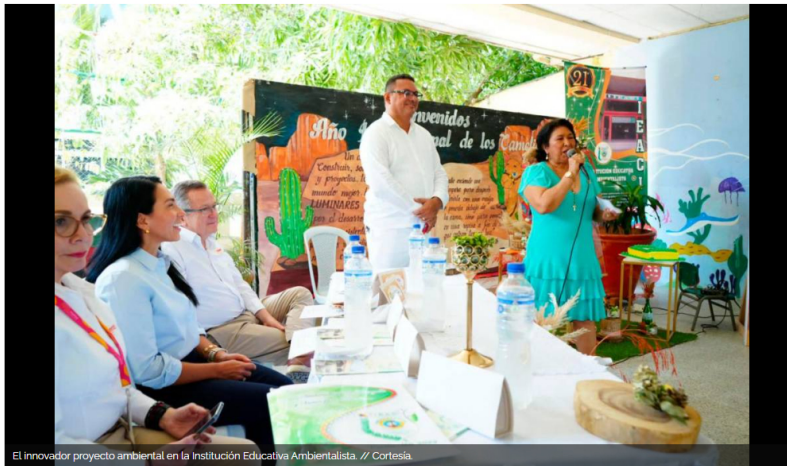
El innovador proyecto ambiental en la Institución Educativa Ambientalista.

El proyecto surge de la mano de Esenttia, empresa del Grupo Ecopetrol, en alianza con la Secretaría de Educación Distrital de la Alcaldía Mayor de Cartagena.